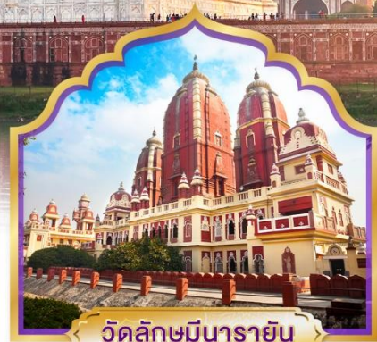
วัดลักษมีนารายณ์