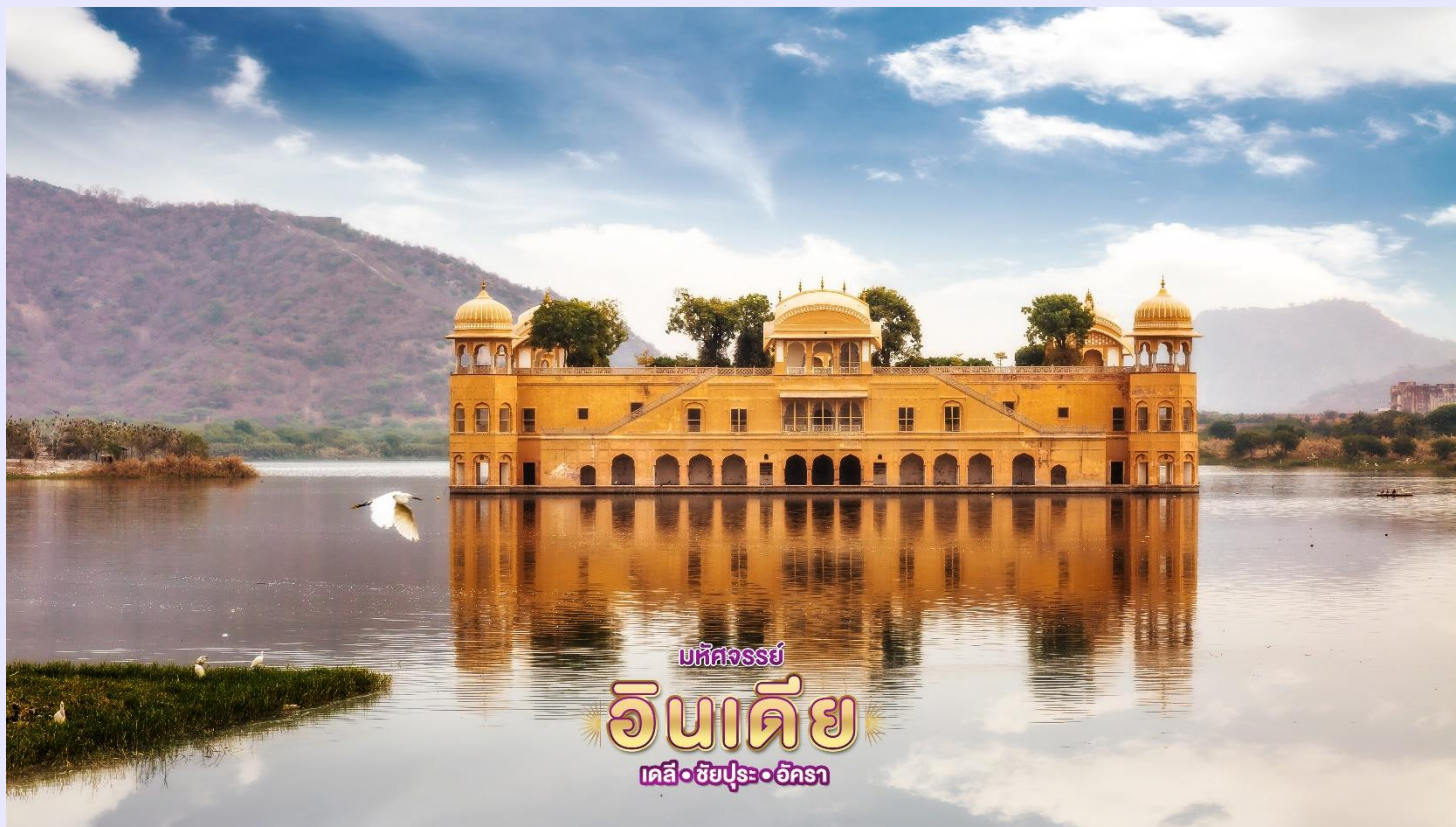
บริษัทจรรยา อินเดีย เดลี • ชัยปุระ • อัครา

จากนั้น นำท่าน ผ่านชม พระราชวังกลางน้ำ (JAL MAHAL) ตั้งอยู่กลางทะเลสาบ Man Sagar Lake โดยมีเทือกเขาน้ำพุร้อนที่ตั้งอยู่ด้านหลัง และตัวอาคารสร้างด้วยหินทรายสีแดง พระราชวังแห่งนี้มีทั้งหมด 5 ชั้น ซึ่ง 4 ชั้นล่างจะถูกน้ำท่วมเมื่อทะเลสาบมีระดับน้ำสูงสุด และเหลือให้เห็นเพียงชั้นบนสุดเท่านั้น